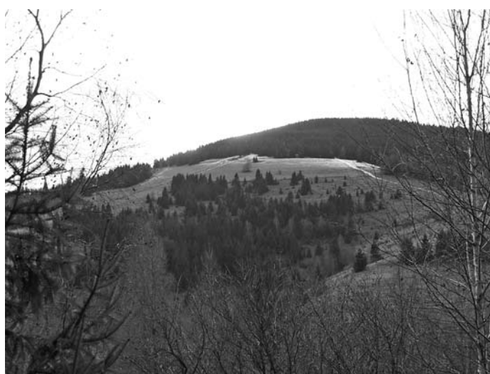
Pohľad na Železnú bránu - Silvester 2006

11.2. - Trenčín dospelí - Rebová a Surová (?)