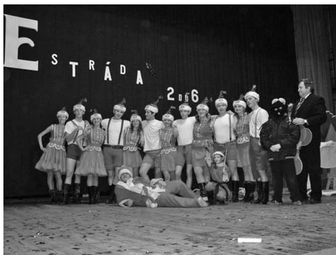
Spoločná fotografia účinkujúcich, ktorí sa podieľali na vydarenej silvestrovej estráde

Od 1. januára 2004 môžu fyzické aj právnické osoby poukázať 2% z dane na verejnosprespešné aktivity mimovládnych neziskových organizácií (MVO). Toto právo si môžu občania, aj firmy uplatňovať na základne nového zákona č. 595/2003 Z.z. O dani z príjmov.