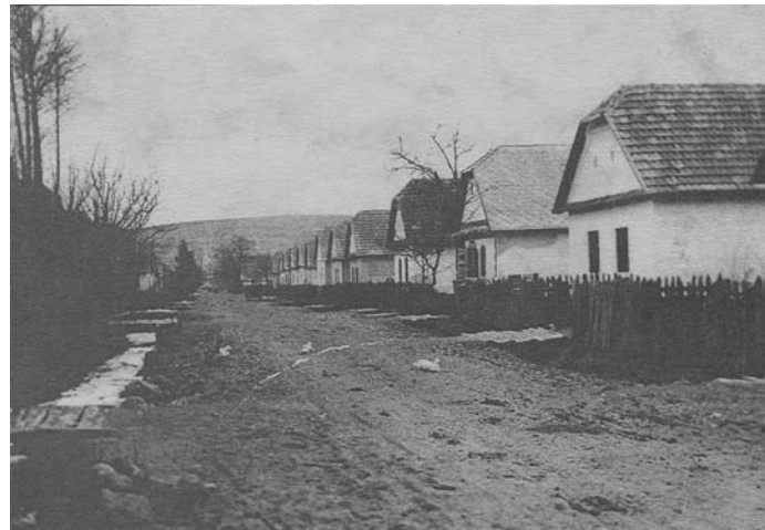
Nový Klenovec v 20. storočí

Vojnové roky ťažko doľahli na Novoklenovčanov. Zapojili sa do boja za národné oslobodenie. V radoch Červej armády bojovalo sedem občanov. V prvom česko – slovenskom armádnom zbore bolo šesťnásť Novoklenovčanov. V boji za slobodu padlo šesť vojakov Červej armády a dvaja príslušníci