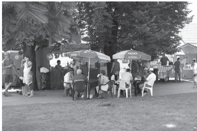
Prijemná, uvoľnená atmosféra charakterizovala tohtoročné Gemersko-malohontské folklórne slávnosti

čanský a gazdovský. Každý z nich mal svoje osobitosti, iný charakter, ráz a zameranie. Škoda, že v programovom bulletinu nie je o nich bližšia zmienka a dôkladnejšia propagácia. Veď práve dvory sú čímsi ojedinelým, čo odlišuje Rontouku od iných podujatí. Majú svoj veľavravný zmysel poznávací, relaxačný, ale aj účelový. K ich hodnote prispieva aj to, že sa v nich prezentujú menšie inštrumentálne zoskupenia (viď. heligonári). Ak by to okolnosti dovoľovali,