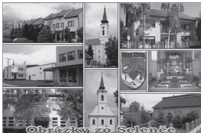
Obrázky zo Selenče