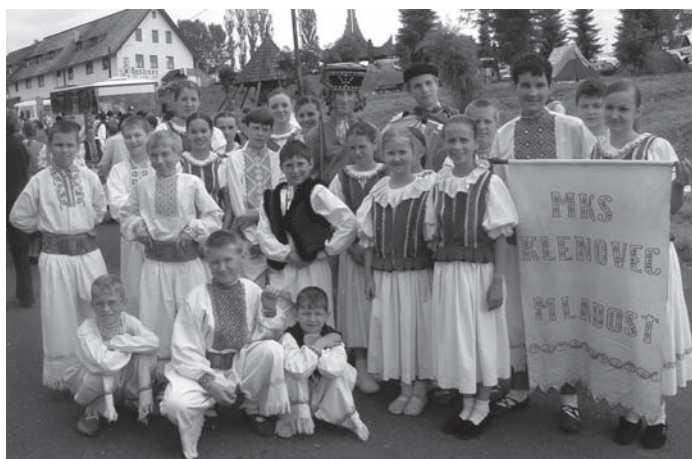
Folkloristi z DFS Mladost' na tohtoročnej Východnej