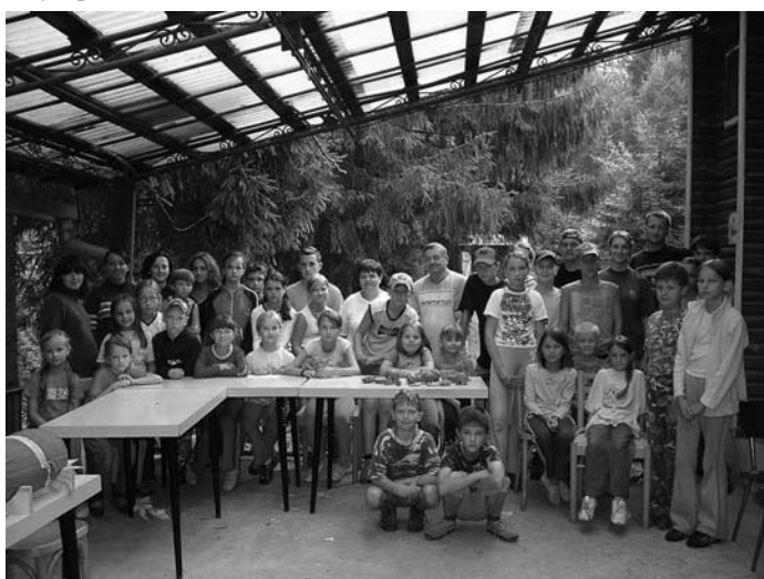
Spoločná fotografia účastníkov prázdninového tábora