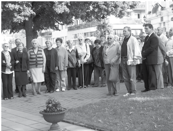
Účastníci spomienky na Slovenské národné povstanie