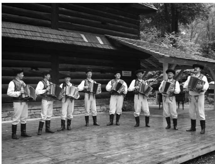
Klenovskí heligonkári v Rožnove pod Radhoštom

*10.-14. augusta sa FS Vepor zúčastnil na IX. ročníku medzinárodných folklórnych konfrontácií v meste Olešnica v Poľsku, kde tancovali spolu s folklórnymi súbormi z Maďarska, Ukrajiny a domáceho Poľska. Práve z tejto oblasti k nám takmer každoročne zavítajú muzikanti Smyky, ktorých sme mohli vidieť i na Klenovskej rontouke.