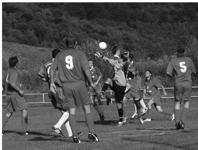
Častý obraz v stretnutí s Olovármí - brankár hostí v obkľúčení domácich. (Klenovec - Olováry 2:2).