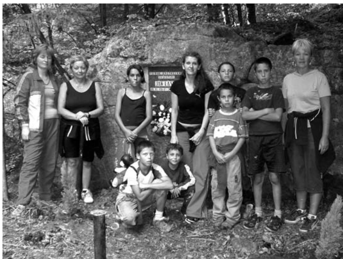
Účastníci výstupu na Klenovský Vepor pred pomníkom padlého partizána Jána Lásku v Skorušine