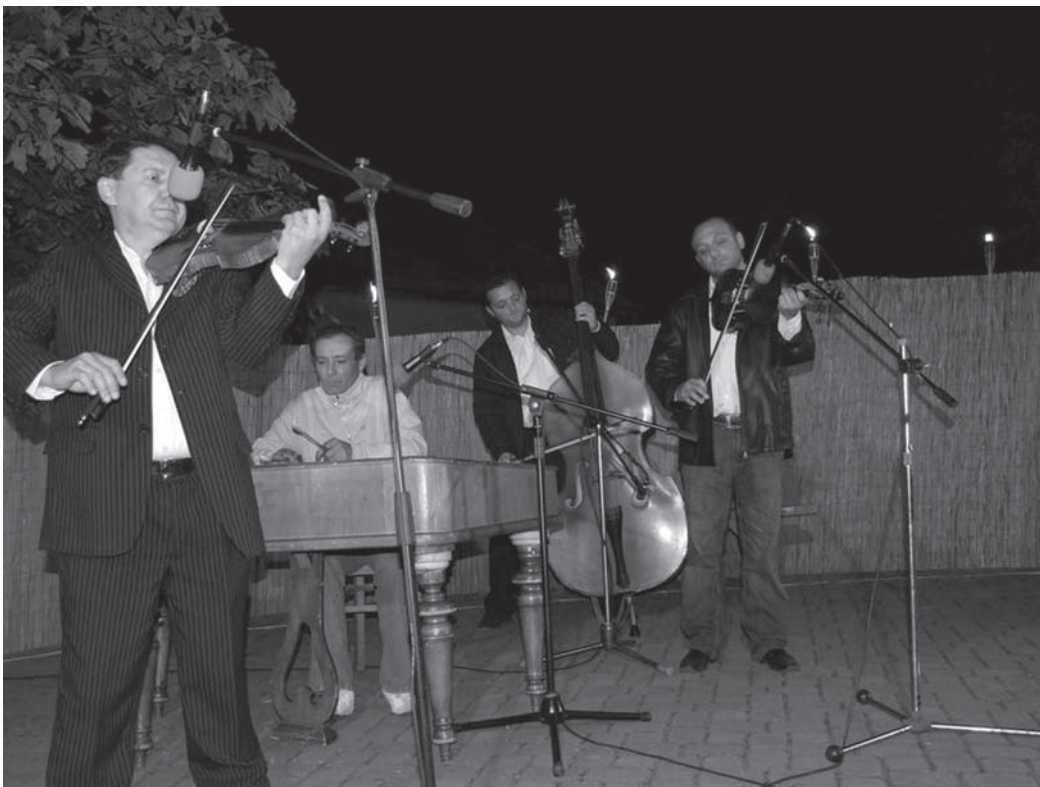
Na festivale Návraty k hudobným tradíciám vystúpila aj domáca ľudová hudba FS Vepor