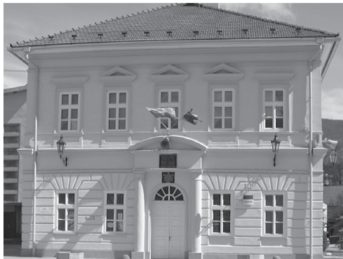
O posty starostu obce a poslancov obecného zastupiteľstva sa v nastávajúcich voľbách uchádza 41 kandidátov

Po takýchto nezhodách, raz áno, potom zas nie, predseda strany SMER všetkým zatelefonoval, že nakoľko