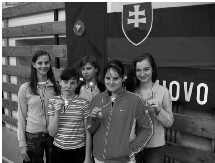
Dúfame, že aj v tejto sezóne sa naša bedmintová mládež bude z majstrovských súťaží vracat ovešaná medailami