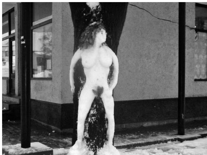
Týmto plníme svoj sľub z minulého čísla našich novín a uverejňujeme fotografiu druhého občana, vlastne občianky Klenovca, ktorá sa objavila na krátky čas medzi nami začiatkom januára. Keďže autori tohto dielka sa nám zatiaľ neozvali, opätovne ich vyzývame, aby svoje mená oznámili redakcii KN.