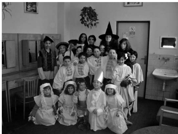
Spoločná fotografia účinkujúcich fašiangového predstavenia