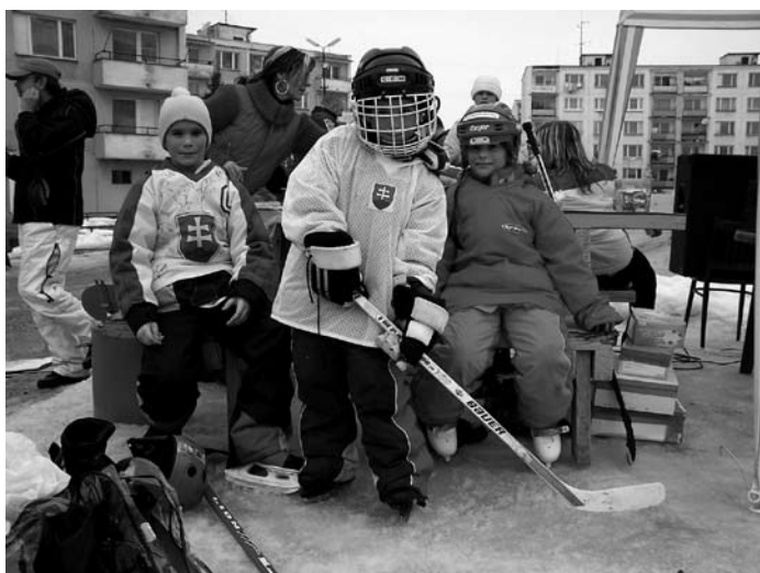
Na ukončení hokejovej sezóny sa mohli predviesť v plnej športovej zbroji aj najmladšie talenty. Spokojní s vydareným podujatím boli aj dobrovoľní organizátori.