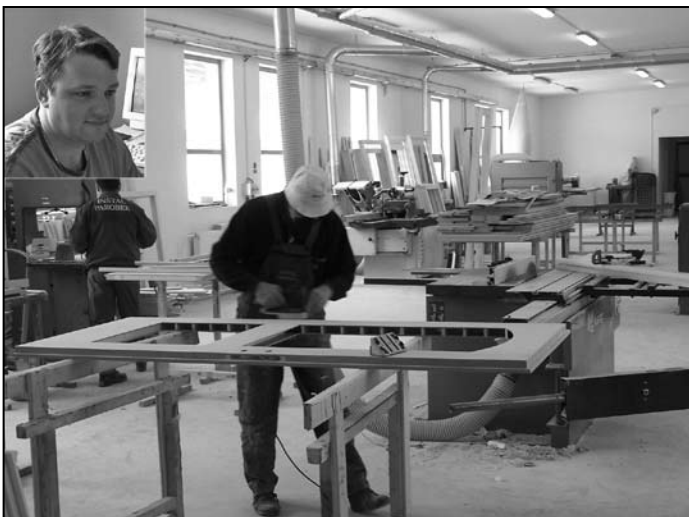
Pohľad do novej výrobnéj haly firmy Inštal Parobek, ktorá bola vybudovaná v minulom roku, a znamená viac priestoru a možnosť rozšírenia výrobných kapacít.