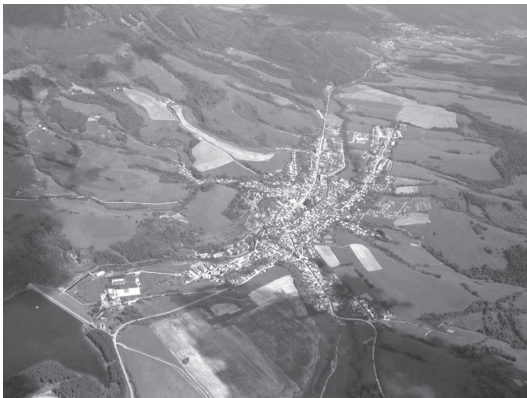
Klenovec, ako ho vidí paraglidista

val život v našej obci, ako aj stretnutie so zaujímavými ľuďmi, ktorí v každodennom živote svojou prácou a záujmami prispievajú k jej zveľa-