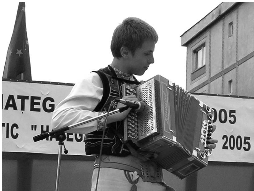
Umenie klenovských majstrov kušnierov môžeme dnes vidieť už iba na kožúškoch našich folkloristov

Ženy a slobodné dievky nosili aj dlhé kožuchy, lemované v spodnej alebo aj v zapínacej časti. Boli to „slovenské kožuchy“ na rozdiel od „kupenských kožuchov“, ktoré mohli byť z kožušín zvierat alebo z umelej hmoty. Boli to „fabrické“ kožuchy. Ornamentálne zdobenie kušnier i dávali aj na prednú spodnú časť kabaníc a na vyšivky nohavíc, na