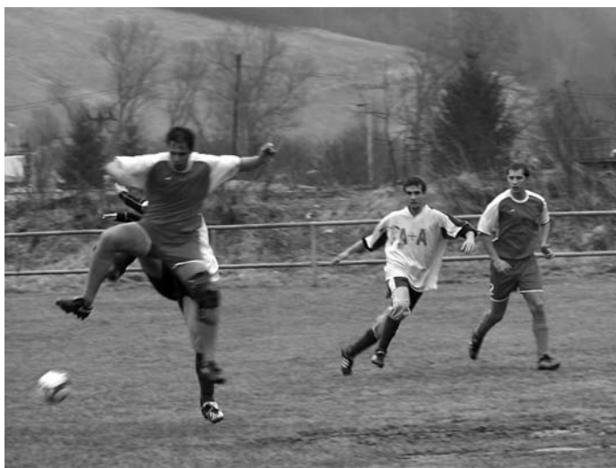
Boháčik eliminuje útok súpera (Klenovec - Čierny Balog 1:1)