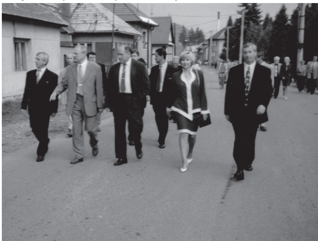
Jeden z prezidentských kandidátov, súčasný prezident Ivan Gašparovič, navštívil Klenovec ešte ako predseda NR SR v roku 1997