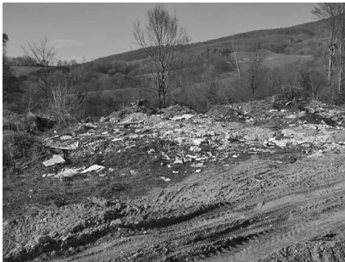
Nelegálne skládky odpadu sa v poslednej dobe množia v okrajových častiach obce ako huby po daždi

rá musela zabezpečiť rôzne mechanizmy, ktoré tento odpad následne odstránili. Preto sme upozornili občanov rozhlasom a bolo to aj v káblovej televízii, že od teraz, od tohto nariadenia, keďže je občan zodpovedný aj za takýto odpad po rekonštrukciách a prestavbách rodinných domov, má povinnosť jeho likvidáciu dohodnúť s Technickými službami v Hnúšti, ktoré mu ho za úhradu odvezú, alebo si ho odvezie sám a obecná polícia a obec ako celok bude sledovať, kto