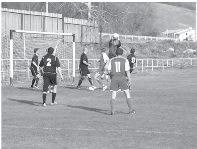
Najpopulárnejšiemu športu sa veľmi nedarí - futbalisti pravidelne bojujú o záchranu v V. lige