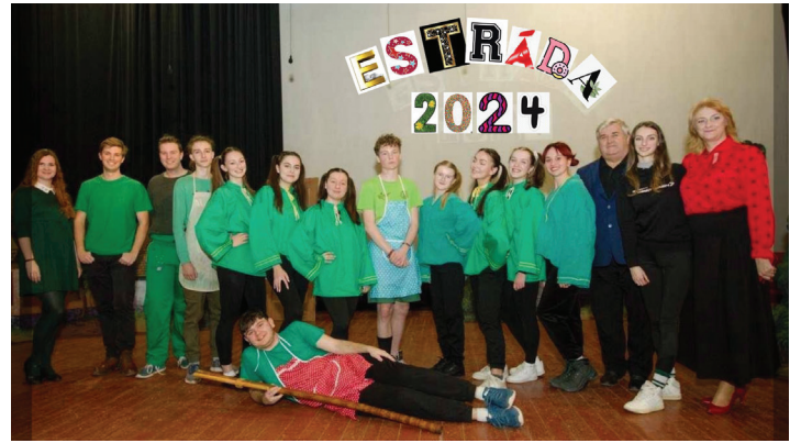
Členovia FS Vepor aj v závere uplynulého roka pripravili pestrý program tradičnej Silvestrovskej estrády.

mavé ceny, čo prispelo k ešte väčšej spokojnosti návštevníkov. Celý večer prebehol bez akýchkoľvek problémov či incidentov, čo organizátori hodnotia ako veľký úspech. - „Sme veľmi radi, že sa všetci zabavili a že sa podarilo zorganizovať podujatie na takej vysokej úrovni. Ďakujeme všetkým, ktorí prišli a prispeli k výbornej atmosfére,“ - vyjadril sa jeden z organizátorov. Štefanská tancovačka v Klenovci opäť potvrdila, že je jedným z najobľúbenejších podujatí v regióne, na ktoré sa návštevníci radi vracajú. Organizátori už teraz premýšľajú o ďalších ročníkoch, ktoré by mali byť rovnako úspešné. M. Sojka