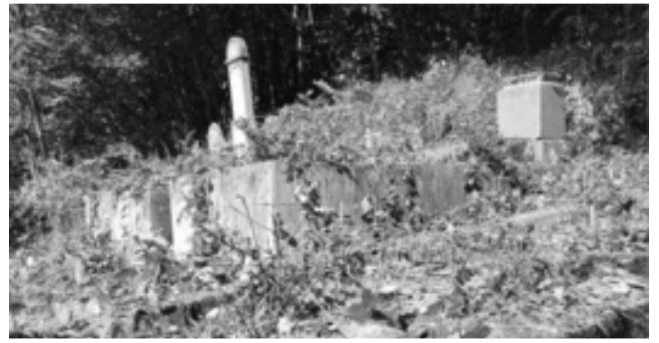
Opustený židovský cintorín v Klenovci.

V klenovskej kronike sa v štatistike sčítania ľudu z roku 1940 spomína nič nehovoriace číslo - 37 Židov. Bolo ich v roku 1942 v Klenovci viac či menej? Ľudských obeť zvráteného myslenia. Málo či veľa? Kvapka v rieke, ktorá naplnila more miliónov obeť holokaustu.