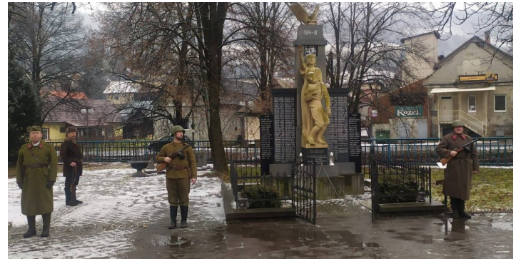
Pamätník padlých obetí na Námestí Karola Salvu v Klenovci.