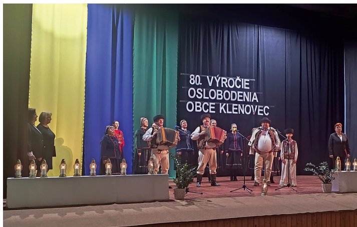
Spomienková slávnosť v kultúrnom dome k 80.výročíu oslobodenia obce.