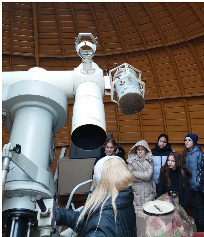
Žiaci našej základnej školy s MŠ počas návštevy rimavskosobotskej hvezdárne.

Sobotě. Ich cieľom bola návšteva Gemersko-malohontského múzea a hvezdárne. V múzeu sa žia-