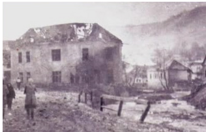
Poškodené domy pri moste, ktorý ustupujúci Nemci zničili pred oslobodením Klenovca.