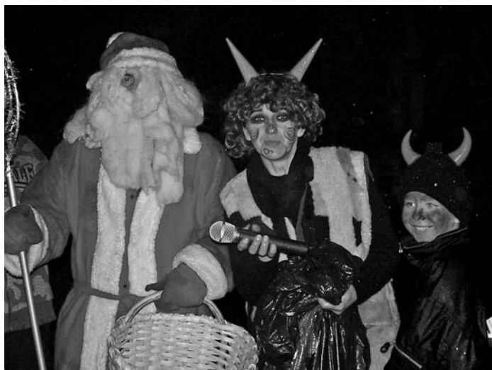
Mikulášovi pri rozdávaní darčiek pomáhali aj čerti