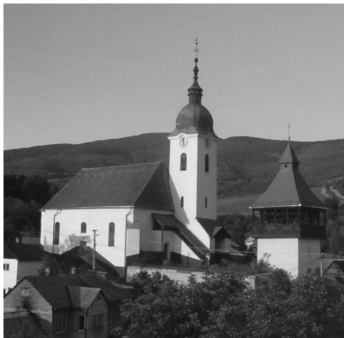
Klenovský evanjelický kostol

cie z roku 1744 bol inventár kostola bohatý a vzácny. Opisuje dva kalichy, medený a zlatý, krčah a dve cinové táčne a prekvapujúce množstvo krásnych liturgických textílií, z ktorých jedna mala nápis „Juditka Rajeczky“.