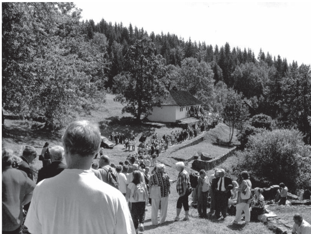
Spomienková slávnosť v Kališti

tov z tohto obdobia nemajú obdobu v dejinách ľudstva. Ich beštialita a porušovanie medzinárodných dohôd a ľudských práv zanechali