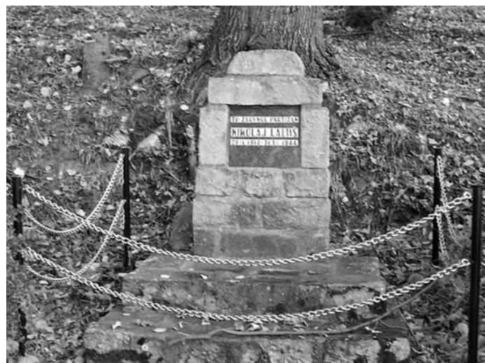
Hrob partizána Nikolaja Lautaša na klenovskej Poľane