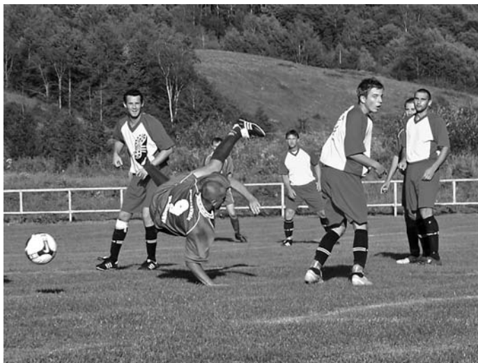
Pokus Medveďa o efektívne zakončenie nevyšiel (Klenovec – Lubeník 2:0)

Prvý polčas stretnutia sa niesol v znamení našej