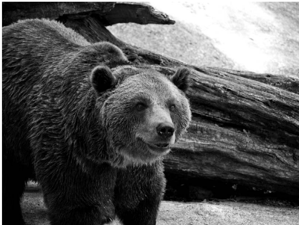
Najväčšia šelma našich hôr

Lenže medveď sa zameriaval aj na včelstvá, kde škody z roka na rok stúpali. Ako všežravec nepohrdol nijakou potravou. Pri „oberaní“ ovocia často poškodil čerešne, jablone i hrušky k veľkej nevôli lazníkov. Keď sme raticovú zver prikrmovali kukuricou a silážou, mohli sme si byť istí, že sa priživí i medveď. Napokon, prečo nie? Aspoň dá pokoj zdroju mäsitej potravy. A v prípade, že skonžumoval zvyšky