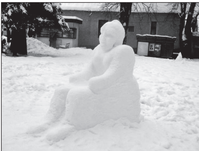
Snehová socha sediacej ženy v parku na Námestí Karola Salvu bola príjemným spestrením jedného z chladných januárových rán.