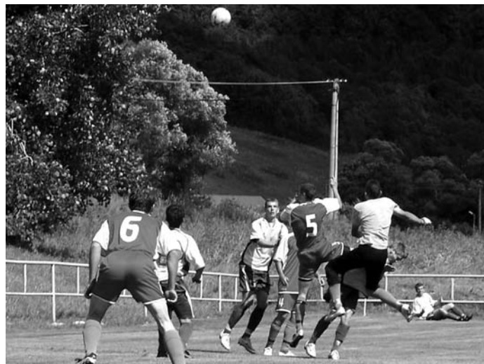
Ani teraz si lopta cestu do siete nenašla (Klenovec - Č. Balog 1:2)

J. B.: I. trieda oblastného majstrovstva, v ktorej štartujú mužstvá z okresov Revúca a Rimavská Sobota, by mala byť kvalitnou a vyrovnanou súťažou. Našimi súpermi budú napríklad Lubeňik, ktorý spolu s nami zostúpil z V. ligy, mužstvá z Tornale, Jelšavy, Muráňa, Bátky a ďalší. Pred súťažou je silu týchto mužstiev vzhľadom na možný pohyb hráčov ťažko odhadnúť. Preto očakávame náročné boje a našim cieľom je uspieť v nich čo najlepšie.