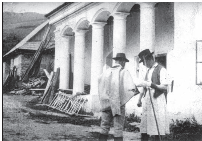
Záber z filmu Strídža spod Hája - dej sa odohráva pred zemianskou kúriou Kubinyjovcov