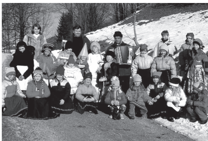
Deti z folklórnych súborov Mladosť a Zornička na fašiangovej pochôdzke po Klenovci