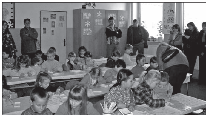
Zápis prváčikov na Základnej škole Vladimíra Mináča