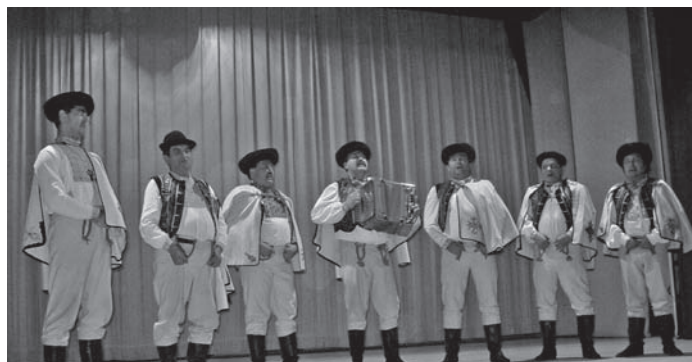
Vystúpenie heligonkárov z FS VEPOR na krste Mikroregiónu SINEC-KOKAVSKO

Zlatým kľincom programu boli najmladší účinkujúci tanečníci z Materskej školy Utekáč. Hnúštu zastupoval zmiešaný spevácky zbor a súbor moderného tanca ECHO a BZUČO. Všetci účinkujúci prispeli k príjemnej atmosfére večera, za čo im patrí veľká vďaka. Želáme im veľa trpezlivosti a úspechov v ďalšej tvorivej práci a hlavne pri získavaní mladých nadšencov pre prácu v týchto kolektívoch.